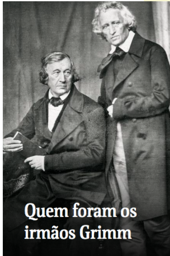
Quem foram os irmãos Grimm

Você provavelmente já se deparou com a frase “O essencial é invisível aos olhos”